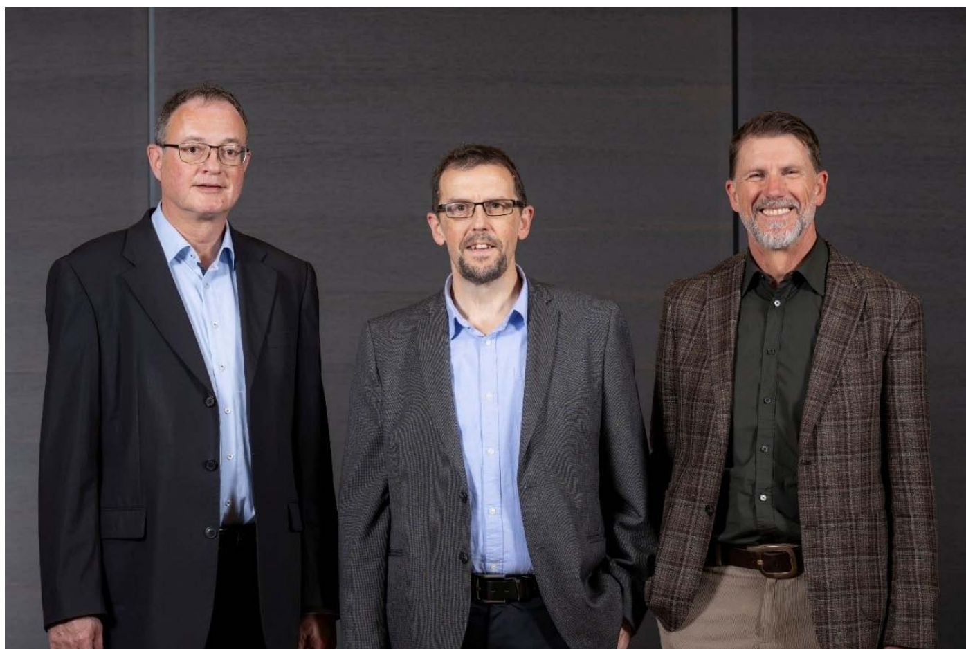
La direction du SAS en 2024