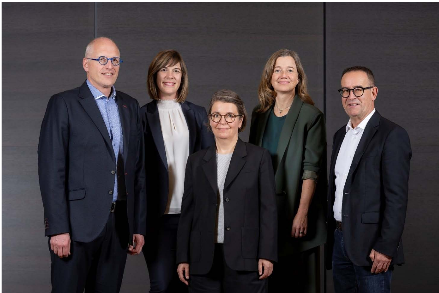
Le conseil d'administration du SAS à partir du 1 juillet 2024

Diplômé en droit, directeur de la paroisse catholique romaine de Berne