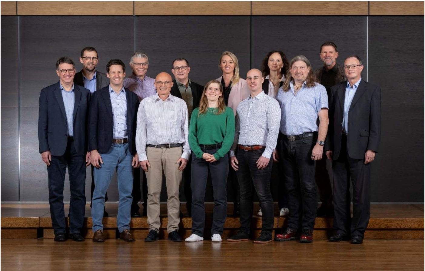
Le personnel du SAS fin 2024